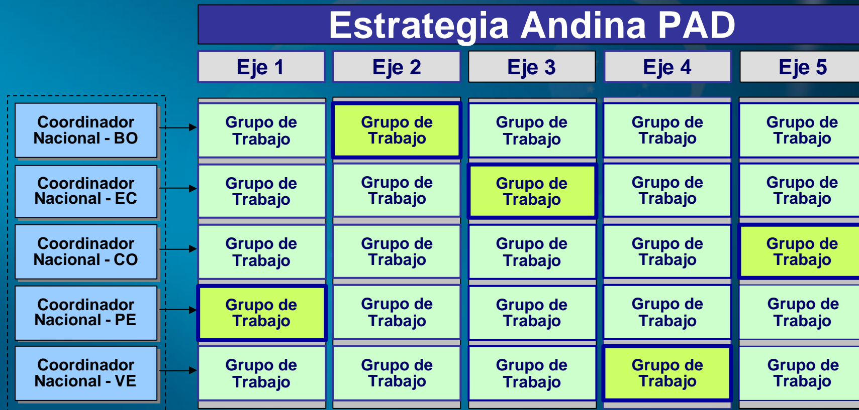
Grupos Nacionales de Trabajo por Ejes Temáticos