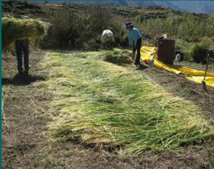
Elaboración de ensilado