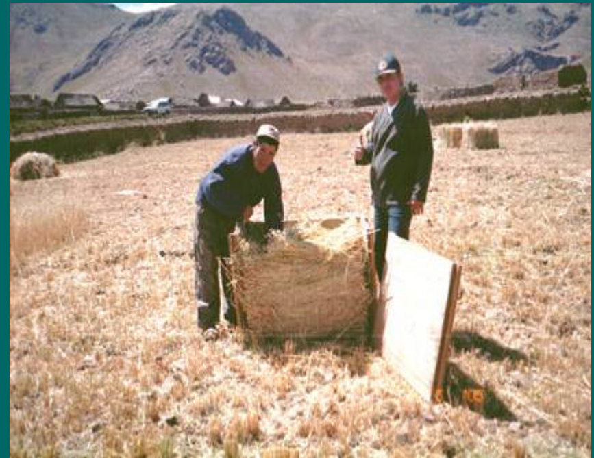
Elaboración de pacas de heno